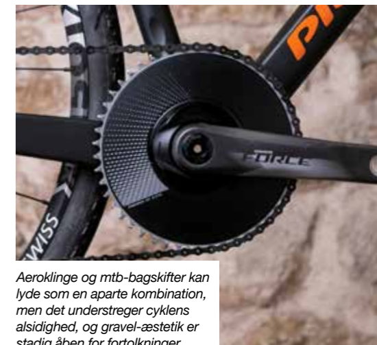
Aeroklinge og mtb-bagskifter kan lyde som en aparte kombination, men det understreger cyklens alsidighed, og gravel-æstetik er stadig åben for fortolkninger.

Det mest iøjnefaldende på Pronghorn CX + Gravel Carbon Disc er 1x12 gearingen med dens enlige 48-tænders aeroklinge og SRAM's elektroniske MTB-bagskifter XX1 Eagle AXS, der skal gabe over en 10/50 kassette. Det understøtter billedet af en hybrid, der skal tilgodesse aerodynamisk landevejskørsel og små stejle bakker på crossbanen og i skoven. Med DTSwiss 1501 har Pronghorn valgt et stærkt hjulsæt med plads til brede dæk, og med 38 mm Challenge Gravel Grinder TLR var cyklen sat op til gravel på Mallorcas noget stenede grusveje. Ved vores vejning kom cyklen op på 8,16 kilo mod de 7,6 kg, som Pronghorn selv anfører. Den lave vægt understøtter indtrykket af en væddeløber, som kan blive endnu