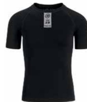
SKINFOIL SPRING FALL SS BASE LAYER