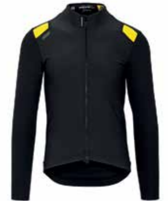
EQUIPE RS SPRING FALL JACKET