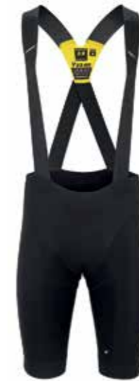
EQUIPE RS SPRING FALL BIB SHORTS S9